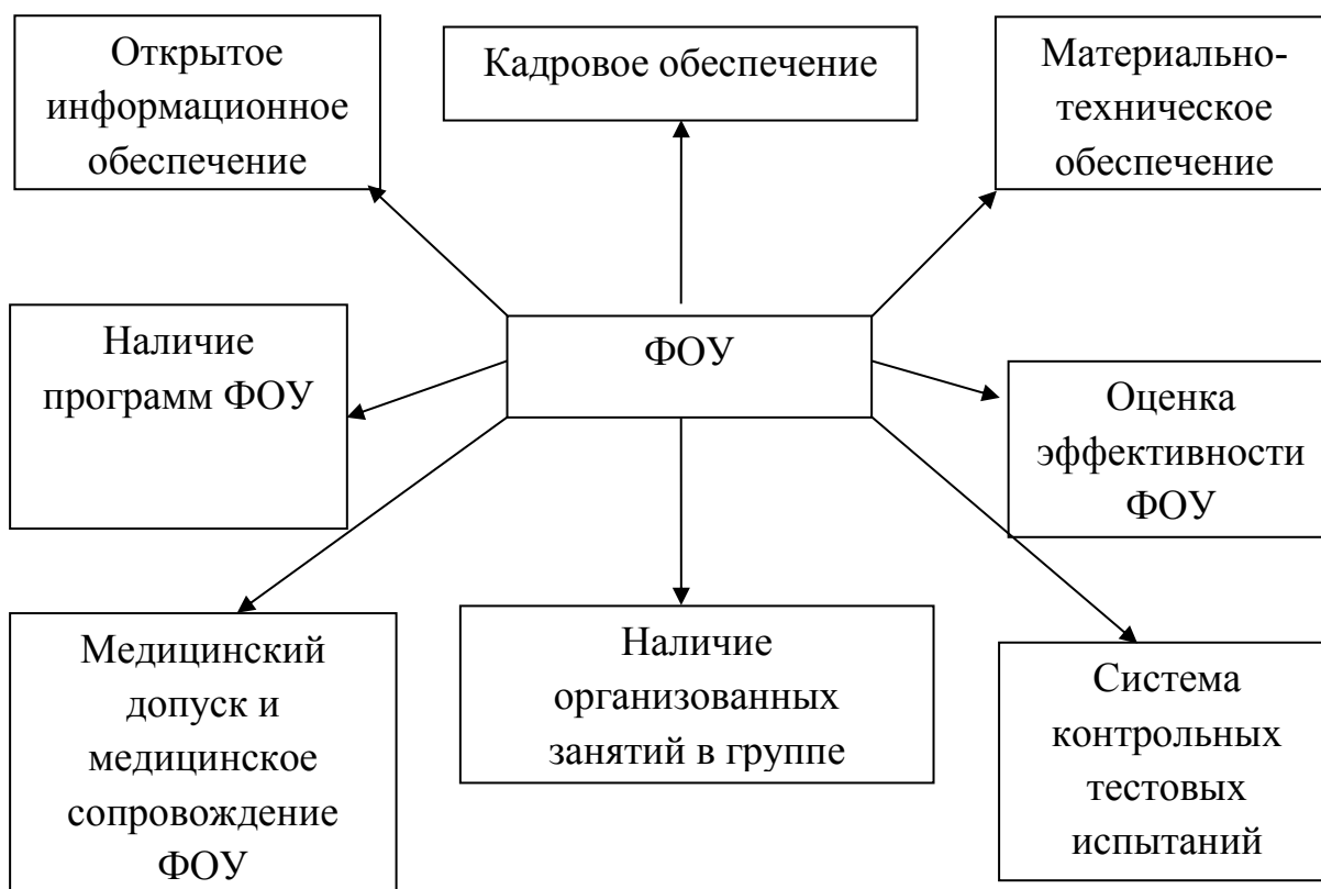
Рисунок 1 – Вариант структуры физкультурно-оздоровительных услуг В стандарте должны быть изложены:

Модель стандарта предоставления физкультурно-оздоровительных услуг физкультурно-спортивными организациями состоит из нескольких разделов. Проект модели стандарта предоставления физкультурно-оздоровительных услуг негосударственными организациями приведен в Приложении Г .