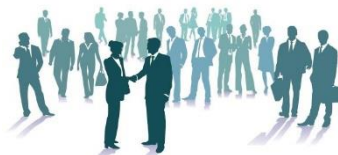
Лица, включенные в перечни лиц, осуществляющих деятельность по организации и проведению азартных игр в соответствии с законодательством Российской Федерации