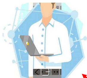
Участник азартных игр

Отказ в переводе и приеме денежных средств (электронных денежных средств)