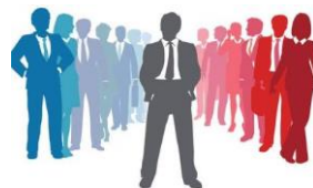
Лицо, включенное в перечень лиц, в пользу которых запрещены переводы денежных средств, в том числе электронных денежных средств