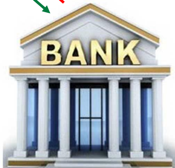
Кредитная организация, платежный агент, оператор связи, оператор почтовой связи

Отказ в переводе и приеме денежных средств (электронных денежных средств)