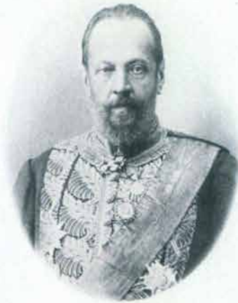
С. Ю. Витте

приказом Министерства финансов Российской Федерации