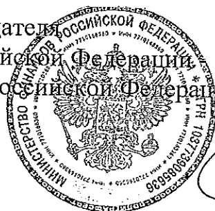
А. Л. Кудрин

Заместитель Председателя Правительства Российской Федерации Министр финансов Российской Федерации