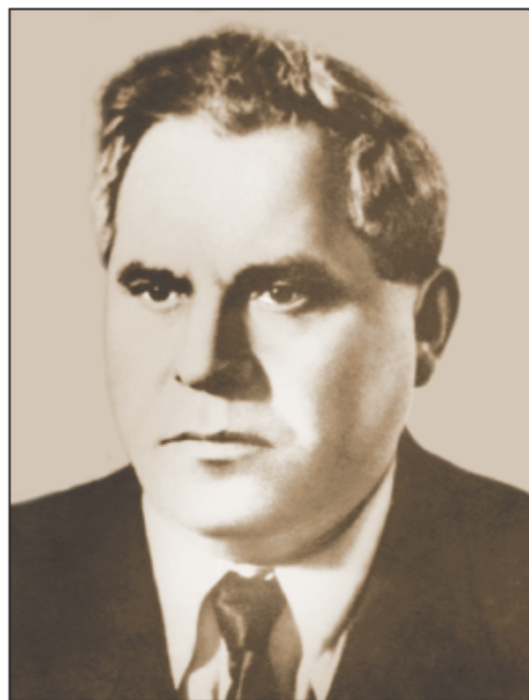
Арсений Григорьевич ЗВЕРЕВ

Награжден четырьмя орденами Ленина, орденами Трудового Красного Знамени и Красной Звезды.